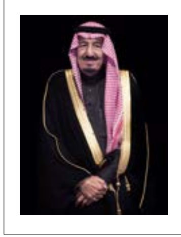
الملك سلمان بن عبدالعزيز آل سعود خادم الحرمين الشريفين