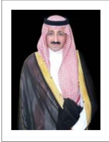
صاحب السمو الأمير بدر بن محمد بن جلوي محافظة الأحساء