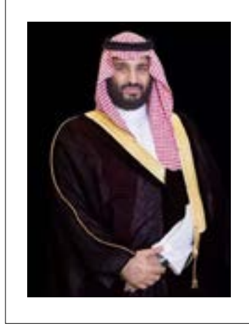
صاحب السمو الملكي الأمير محمد بن سلمان آل سعود ولي العهد نائب رئيس مجلس الوزراء