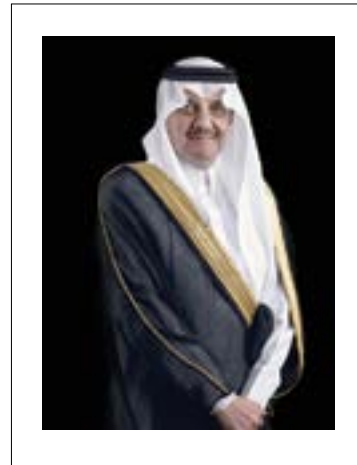
صاحب السمو الملكي الأمير سعود بن نايف بن عبدالعزيز أمير المنطقة الشرقية